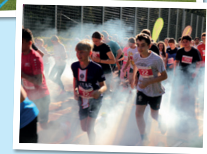
Motivation vom Start bis zum Ziel war gefragt