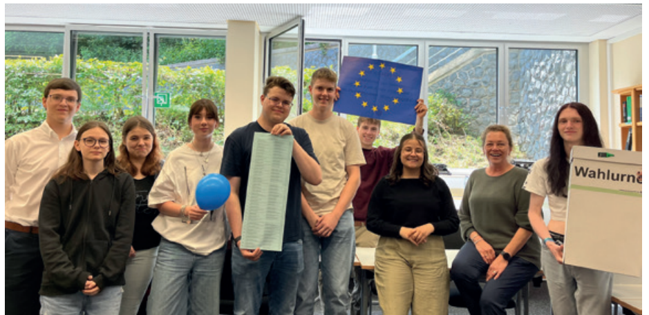
Das Organisationsteam der Juniorwahl