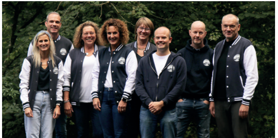
Unsere gesamte Schulleitung