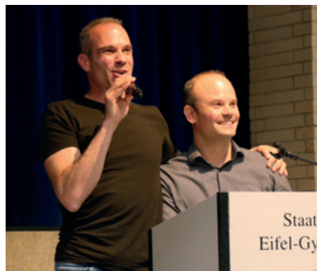
Der Schulleiter und sein neuer Stellvertreter