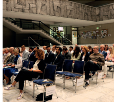
Mit einer schönen Feierstunde verabschiedet sich das Eifel-Kolleg von den Abiturientinnen und Abiturienten

Mit Sonnenschein feierte der Kolleg-Abiturjahrgang 2023/24 am Donnerstag, dem 5. Juli 2024 in familiärer Atmosphäre und voller Vorfreude auf neue Perspektiven den höchsten deutschen Schulabschluss.