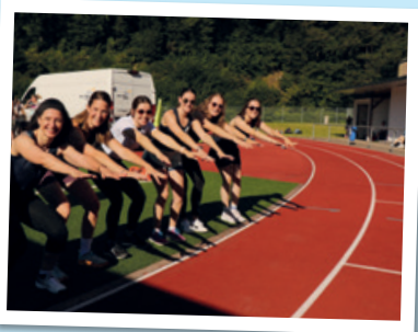
Anfeuern für den guten Zweck