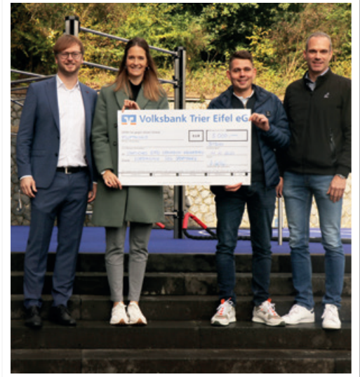
Die symbolische Scheckübergabe der Volksbank Trier Eifel eG

Finanzielle Unterstützung erhielten wir von spendablen Förderern, ohne die die Realisierung der Anlage nicht möglich gewesen wäre. Wir bedanken uns an dieser Stelle im Besonderen bei BILD hilft e. V. „Ein Herz für Kinder“, der Ingeborg-Gross-Stiftung und den Stiftungen der KSK Bitburg sowie der Volksbank Eifel, die uns durch ihre finanziellen Mittel tatkräftig unterstützten.